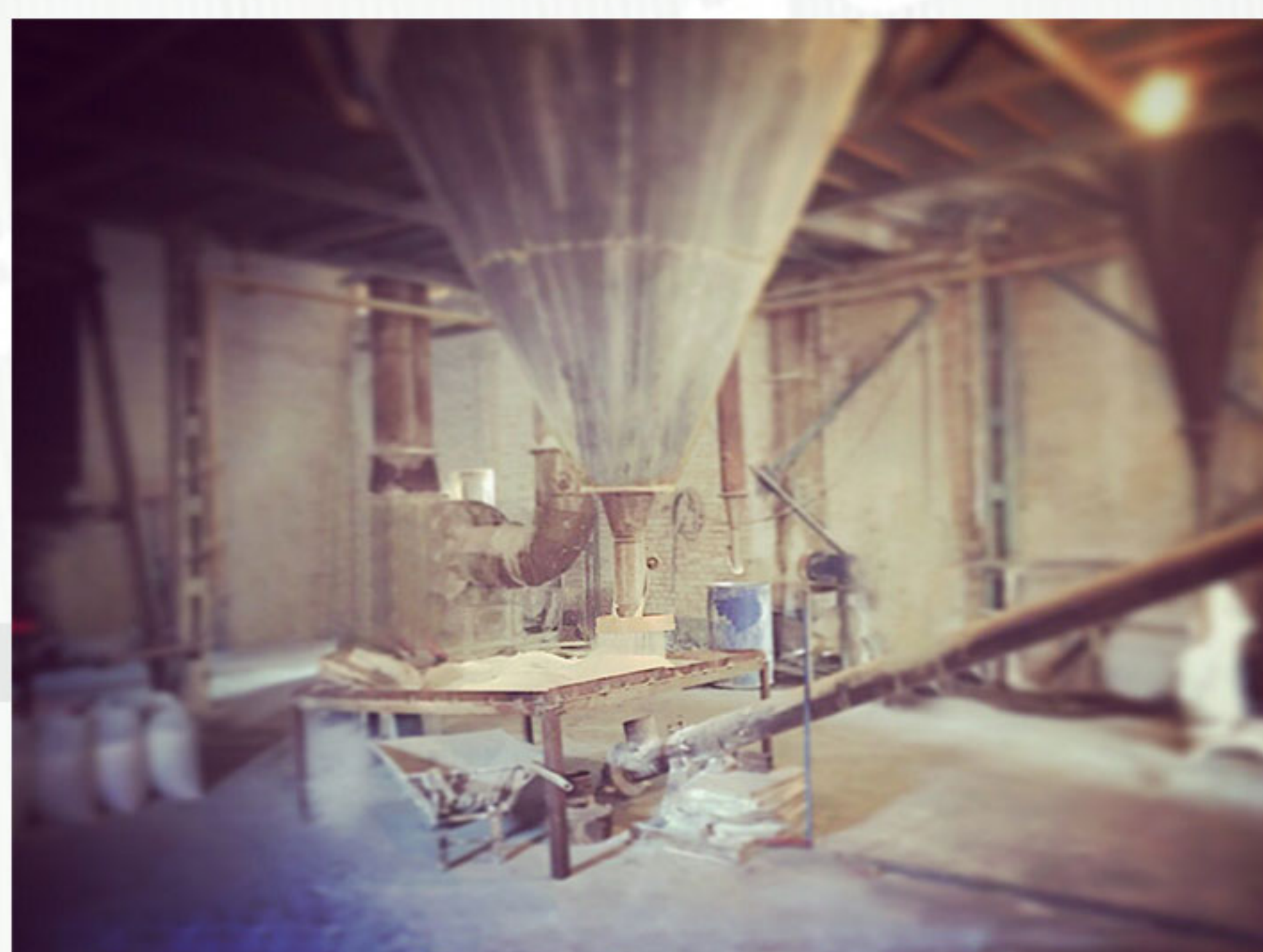
- طبقه ی همکف اسپری درایر خروج سولفات روی

شرکت پتروکود ساوه همچنین از شرکت های مورد تایید شرکت خدمات حمایتی کشاورزی است.