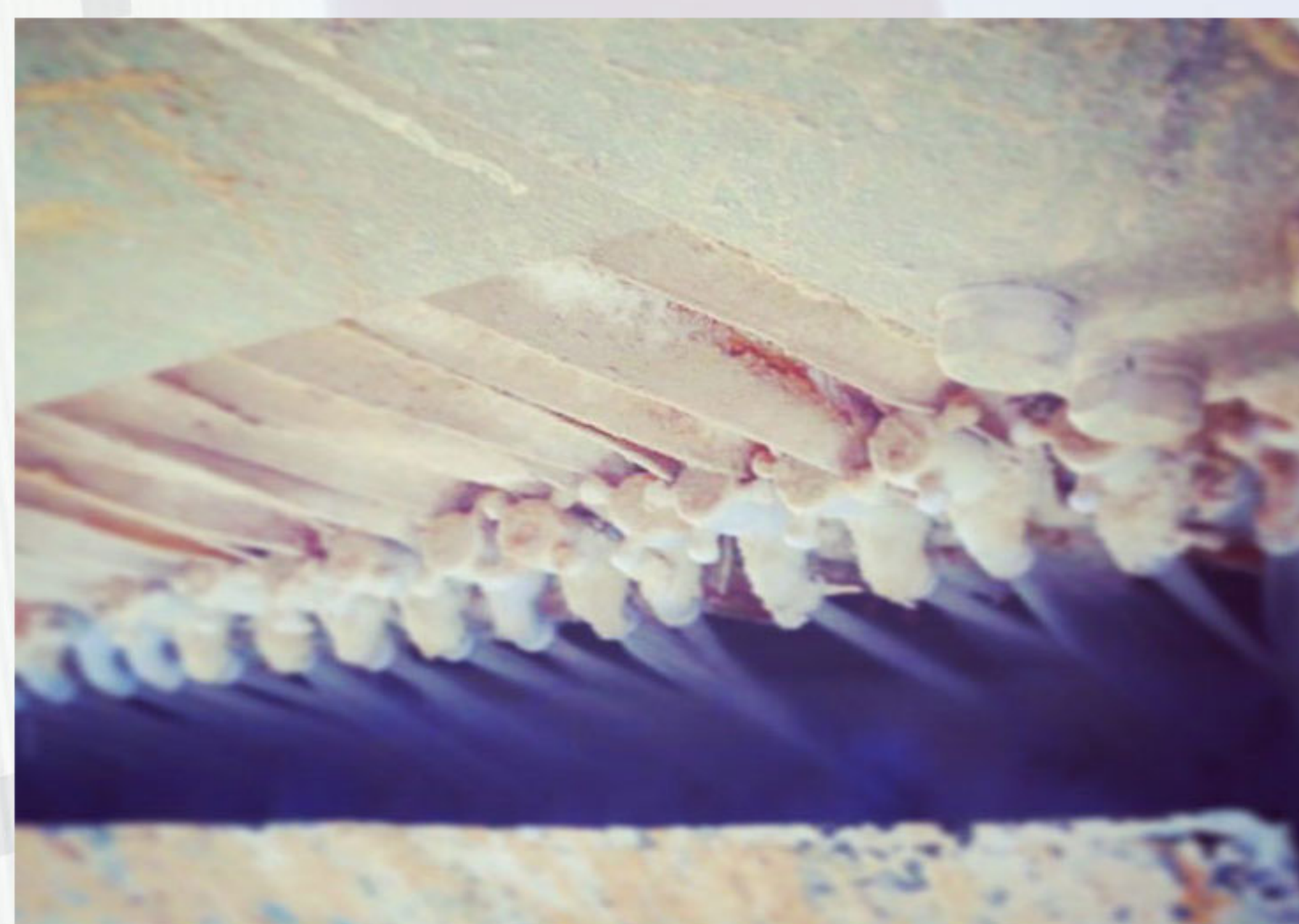
- پاشش محلول سولفات روی توسط اسپری درایر