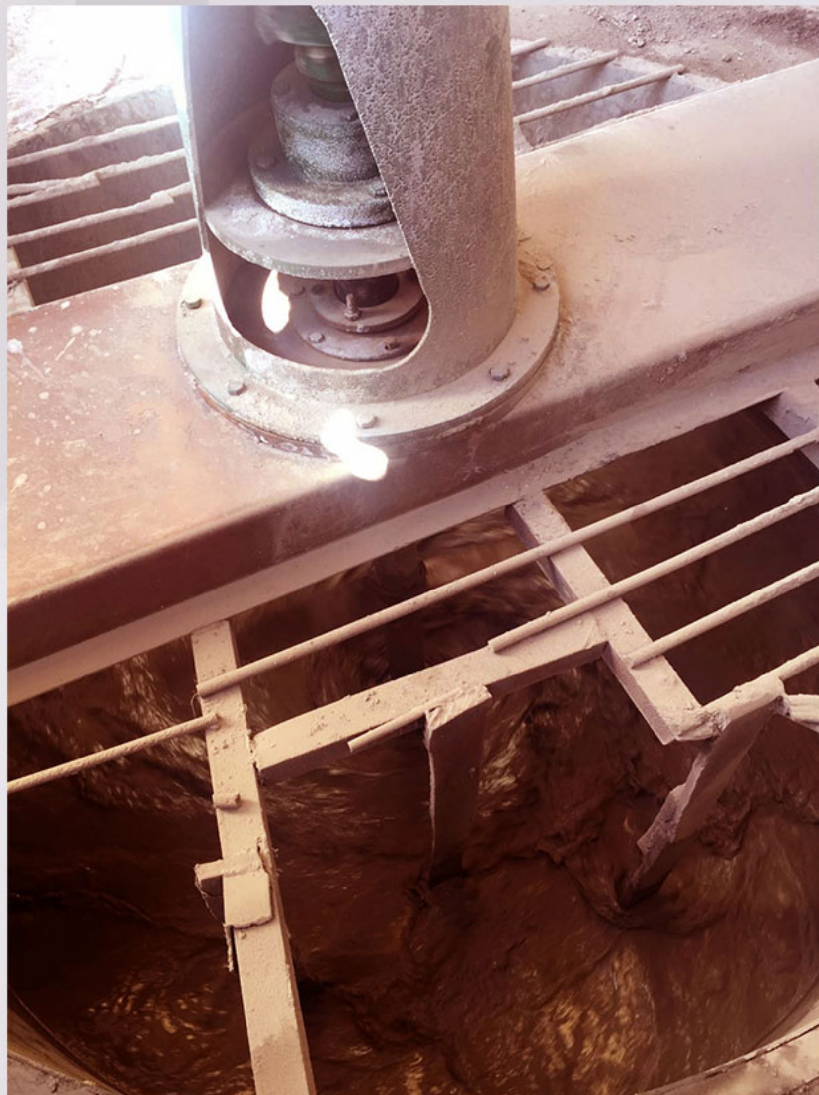
-مرحله ی اول محلول سازی در میکستر زمینی