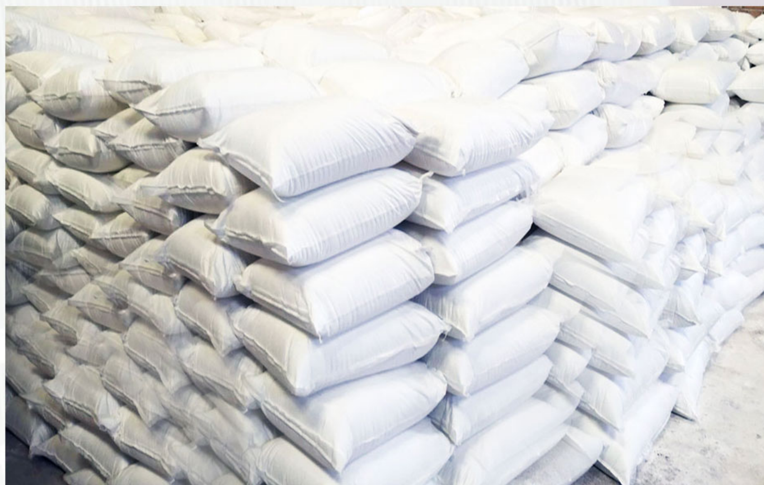
-انبار محصول مخصوص سولفات روی

در صورتی که مصرف کننده سولفات روی با درصد های ۲۴، ۲۲، ۲۰، ۱۸ و ... را سفارش دهد پودر تولیدی پس از اسپری درایر وارد خط تولید دیگری خواهد شد که در آن از طریق گراناتور های مخصوص به درصد مورد نظر خواهد رسید.